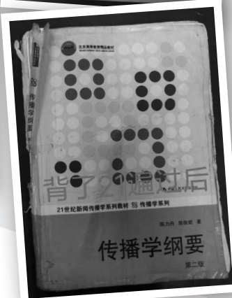
背了21遍的书已很破烂。